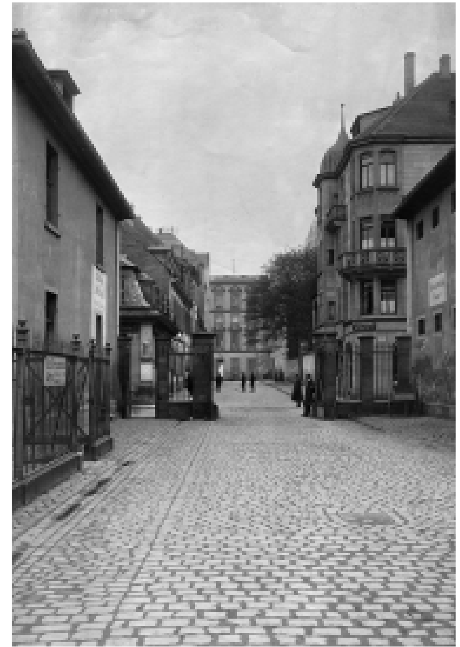
Zwischen Militär und Stadtverwaltung gibt es immer wieder Probleme wegen der durch die Kasernenanlage führenden öffentlichen Kurfürstenstraße, die auf Drängen des Militärs zeitweilig geschlossen wird. Die Tore in Richtung Schloss sind auf diesem um 1920 entstandenen Foto gut zu erkennen.

Weiterführende Informationen: www.mannheim.de