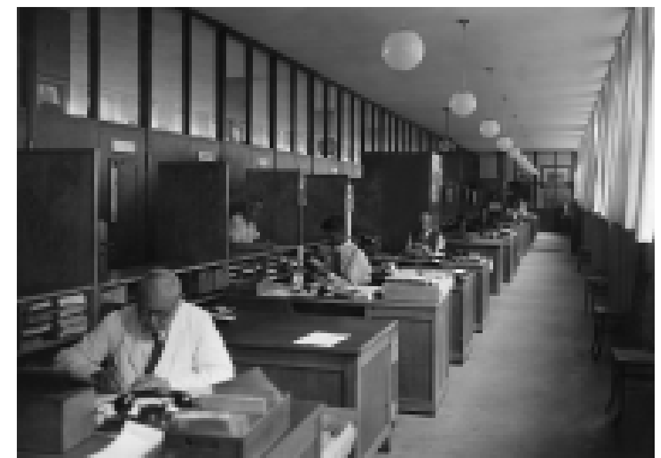
Beamtenraum der Stellenvermittlung für Arbeiter im neuen Arbeitsamt, 1932. An jeden Schreibtisch schließt sich eine Kabine mit einer Tür zum Warteraum an, aus dem die Arbeitssuchenden jeweils einzeln eintreten.