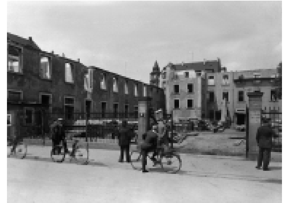
Abbruch der alten Dragonerkaserne, 1930–1932.