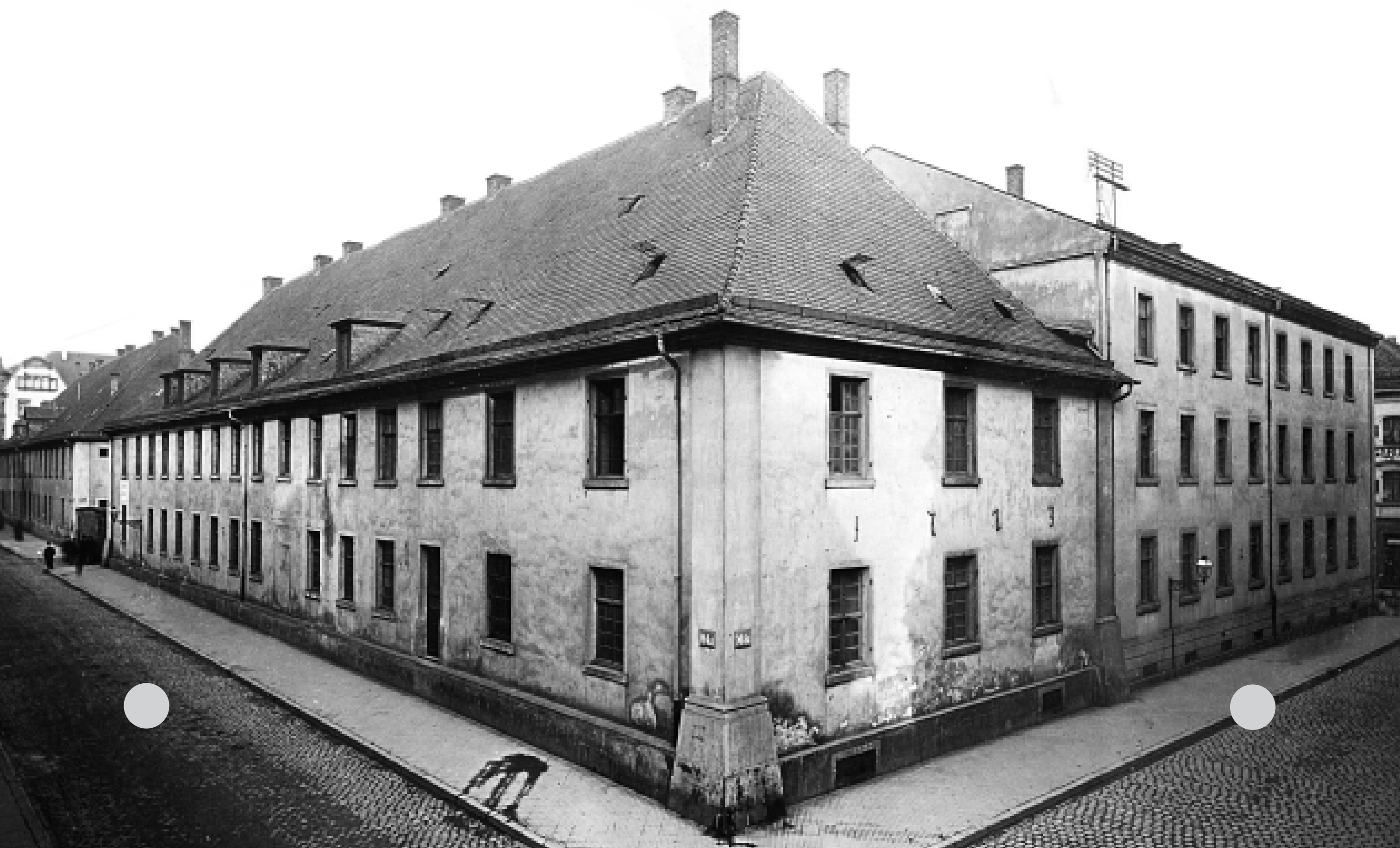
Blick auf die Dragonerkaserne von L 6 aus.