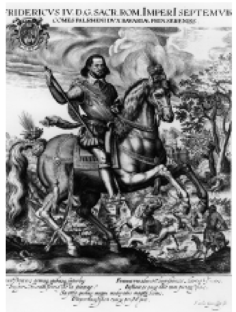
Der Festungs- und Stadtgründer, der pfälzische Kurfürst Friedrich IV. (1574–1610). Sein gleichnamiger Sohn, Kurfürst Friedrich V. (1596–1632), wird durch die Annahme der böhmischen Königskrone den Dreißigjährigen Krieg und damit auch Mannheims erste Zerstörung auslösen.