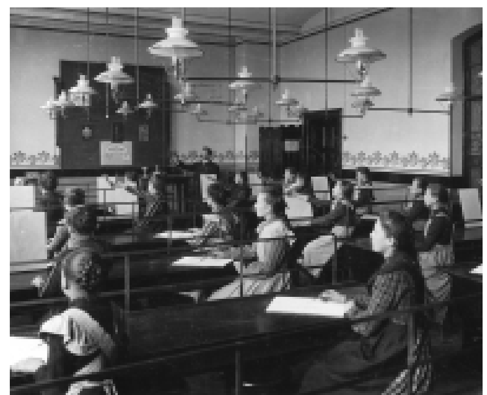
Zeichenunterricht für Mädchen in der K 5-Schule, 1905.