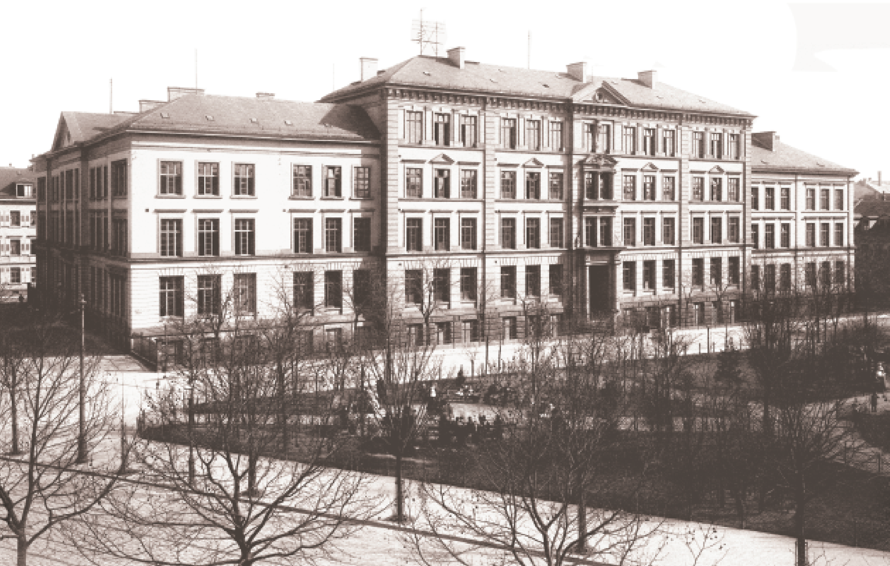
K 5-Schule, um 1900.

Weiterführende Informationen: www.mannheim.de