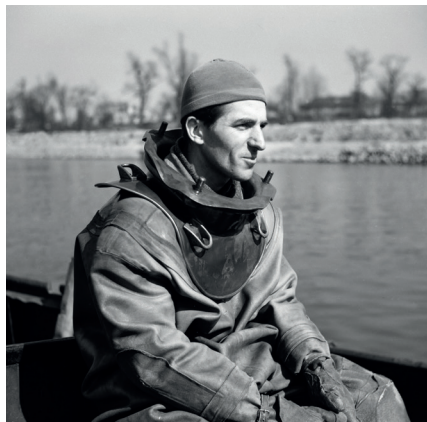
Taucher des Kampfmittelräumdienstes auf dem Rhein, 1949