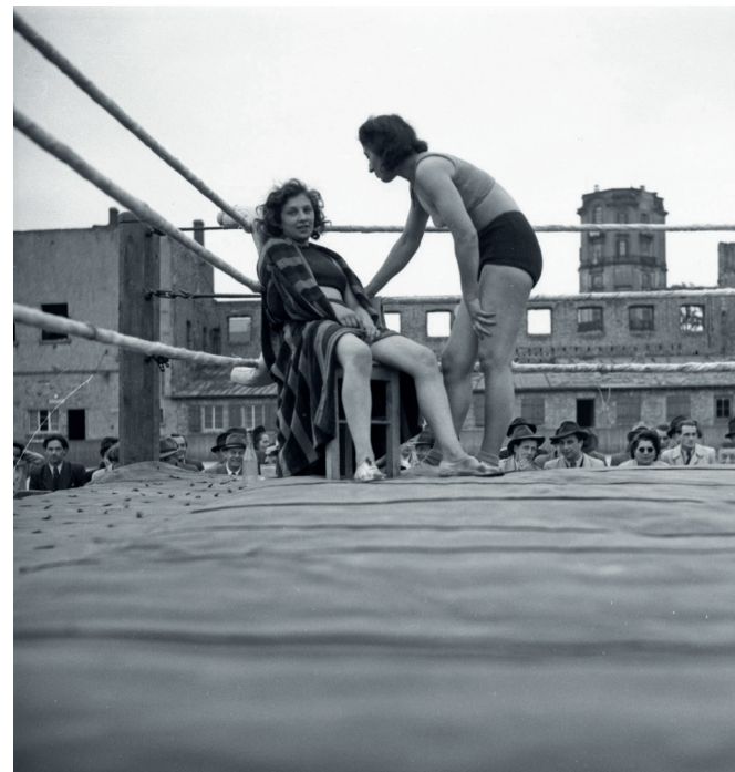
Frauen-Freistilringkampf im Eisstadion Friedrichspark in Mannheim, 1949