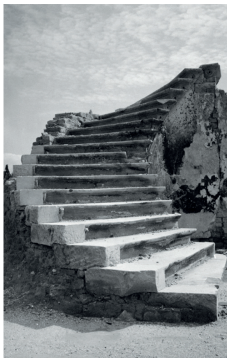
Treppe eines zerstörten Hauses in Mannheim, O 3, 10, ca. 1945