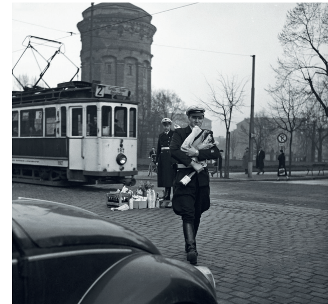
Verkehrspolizisten mit Weihnachtsgeschenken von Autofahrern vor dem Mannheimer Wasserturm, ca. 1955

Aktionstag | Der Eintritt in die Ausstellung ist an diesem Tag frei. Um 16 Uhr findet eine kostenlose Führung statt. Treffpunkt: Foyer im EG des MARCHIVUM