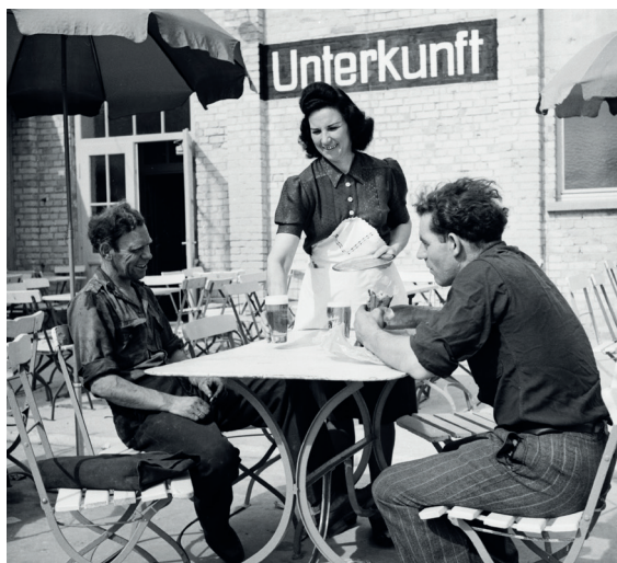
Rastende Fernfahrer am Autohof Mannheim, 1949

Führung | Die Führung stellt Leben und Werk des Fotografenehepaars Roden in den Kontext der Nachkriegszeit in Mannheim. Treffpunkt: Foyer im EG des MARCHIVUM