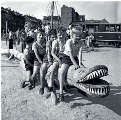
Kinder auf dem Mannheimer Robinson-Spielplatz, 1955